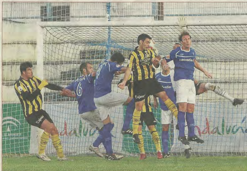
Los astigitanos se defendieron con uñas y dientes durante gran parte del partido y lograron la victoria casi al final.

da ensayada que puso el ¡uy! en las gradas de San Pablo, sirvieron para que el San Roque encerrara en su propio área al Écija, que se quedó sin Bello por lesión a la media hora de juego y se limitó a defenderse como pudo hasta que el colegiado determi-