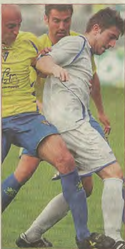
El lateral alcalaño Moreno.

CÁDIZ-ALCALÁ LOS BLANQUIAZULES, QUE SALTARON SIN DELANTEROS, CAEN EN UN MAL PARTIDO DE AMBOS